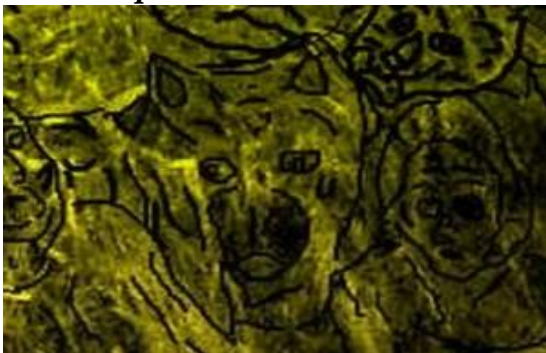
Ilustración 32 Elemento de psicografía el bosque

Un mundo es paralelo a otro, sí y sólo sí, comparte a lo sumo m - 1 dimensiones de un hiperspacio común m dimensional, en el cual coexisten varios mundos de diferentes niveles dimensionales. Por ejemplo, en un multiverso XYZWM , en el cual existen cinco dimensiones, en el pueden coexistir varios mundos de tres y cuatro dimensiones. En este hiperspacio pentadimensional pueden coexistir varios universos tridimensionales y tetradimensionales, como los definidos por los espacios XYZ , XYW , XYM ,