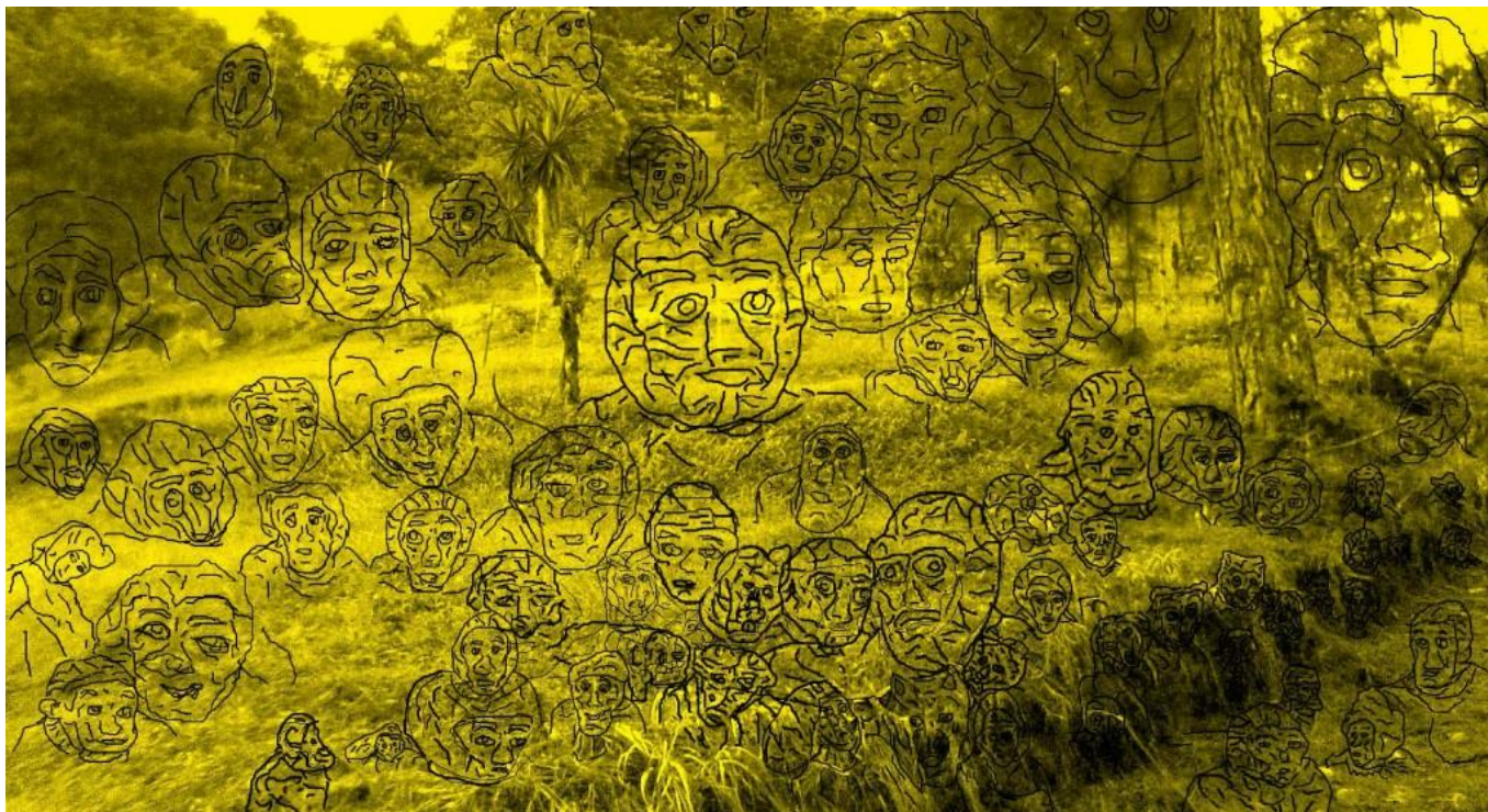
Ilustración 33 Multiplicidad de realidades alternativas

Observe en la figura anterior, como el hipervolumen aparente es compartido por varios seres, dando la sensación de que un ser es parte del otro. Por ejemplo, hay un conjunto figuras de animales, que los muestran como que su cuerpo fuera parte del suelo. Lo mismo podría ocurrir con seres gigantes, que podrían ocupar el hiperespacio aparente de arboledas, presentándose la coexistencia de todos, sin afectar a los demás.