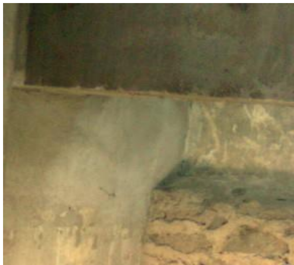
figura se muestra un posible ejemplo de este tipo de manifestación energética. Observe, como en la figura se muestra una cabeza blanquecina, que cuando se observa con cuidado, hasta los ojos pueden diferenciarse, igual que la nariz, la sien y la barbilla. Pero, dentro de lo normal, se debe decir que ahí no hay nada. Esa manifestación a simple vista fue invisible, pero fue capturada por el sustrato.

El cuerpo etéreo estaría conformado con un tipo de energía con niveles de vibración especiales. En la