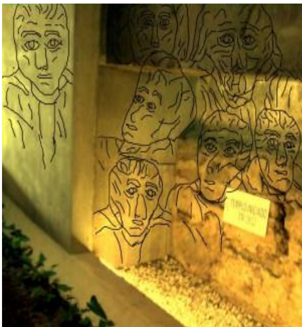
Ilustración 82: Cuerpo etéreo

La figura adjunta muestra una aplicación de la técnica de psicografía de sustrato mencionada en este libro, mostrando una posible forma de dicha entidad. El significado de las líneas dibujadas queda a la interpretación del lector, pues debido a las características de las imágenes de estas psicografías, en un ambiente de coloración tenue, no permite una definición absoluta de su significado. Por ejemplo, las líneas superiores, podría corresponder a una demarcación de una especie de turbante o a un velo, o a una distribución del cabello, o una distribución de piel, dando la sensación de que sea un ser no humano, pero de aspecto humanoide.